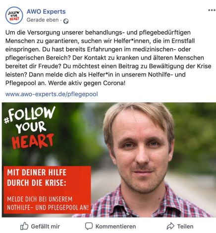
Beispiel für einen Facebook-Beitrag