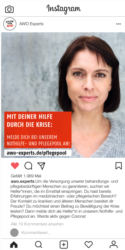
Beispiel für einen Instagram-Beitrag