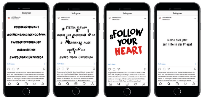
Feed Ad (Facebook, Instagram)