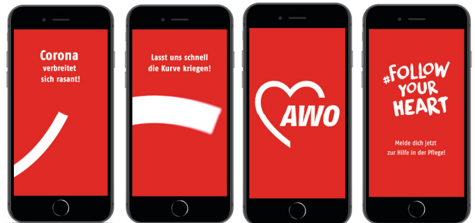
Story Ad (Facebook, Instagram)

* medizinische und pflegerische Fachkräfte (z. B. Altenpfleger*innen, Gesundheits- und Krankenpfleger*innen, Arzthelfer*innen usw.) sowie Hilfskräfte (Pflegefachhelfende, Alltagsbegleiter*innen, ehemalige Zivildienstleistende, BFDler*innen, FSJler*innen, Student*innen der Medizin) und Menschen mit ähnlichen Vorkenntnissen